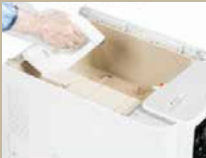
Sterilisasi tabung air dan aliran air

Nikmati Pelayanan CODY untuk setiap pembelian Package 72, 60, 36 dan Filter Package