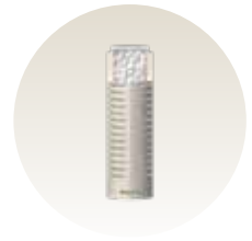
Anti Bacteria Filter