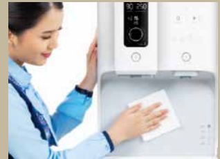
Sanitasi bagian luar produk