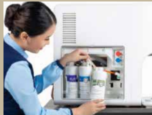
Penggantian filter secara periodik