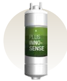
Plus Inno Sense Filter

Menghilangkan lumpur, karat, pasir dan zat kimia lainnya