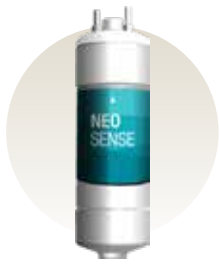
Neo Sense Filter

Menghilangkan lumpur, karat, pasir dan zat kimia lainnya