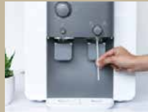
Sanitasi keran air