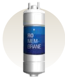
RO Membrane Filter

Menghilangkan bakteri, virus, logam berat dan mineral